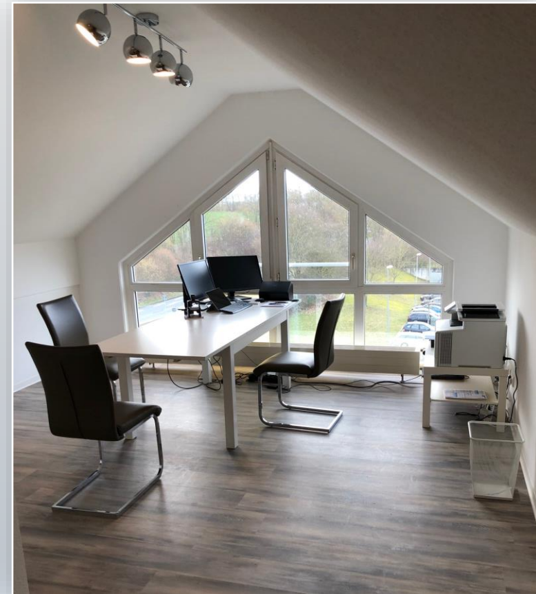
Der Arbeitsplatz eines freien Mitarbeiters

Als alternative Möglichkeiten zu einem persönlichen Gespräch stehen Skype und Microsoft Teams zur Verfügung.